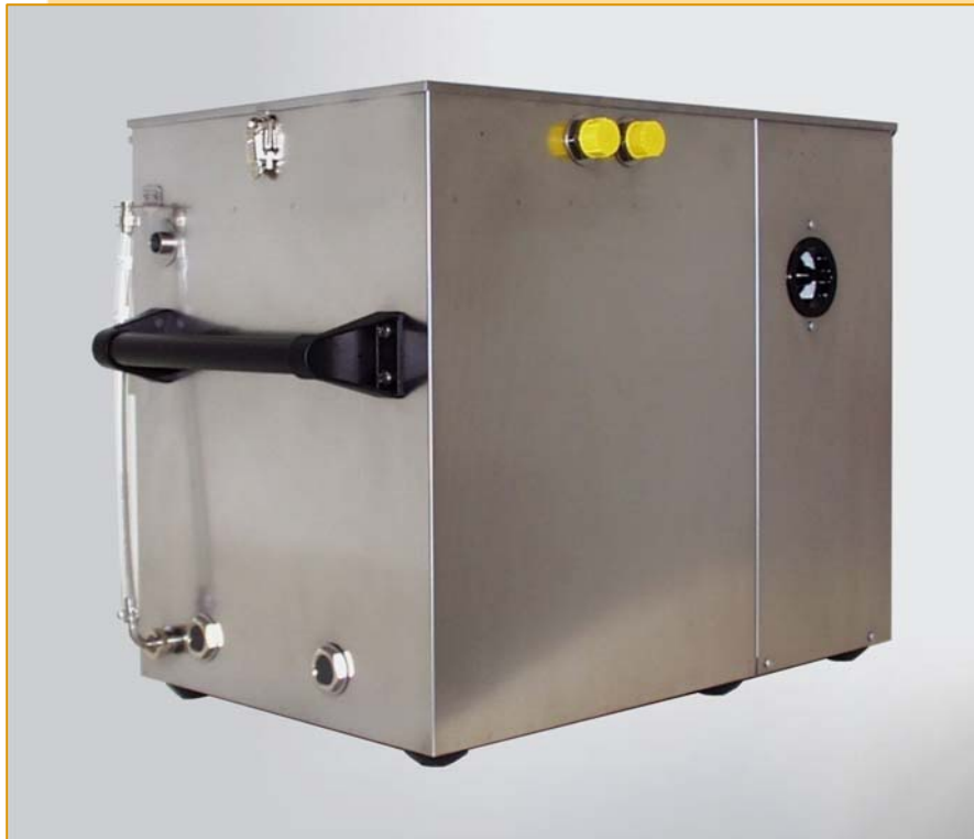
Wasserbadkühler Typ Medi